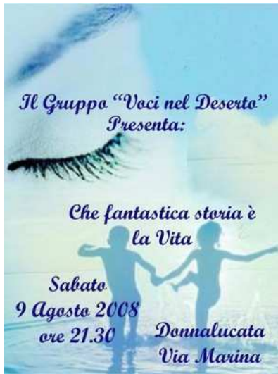
Locandina del Gruppo Voci nel Deserto

I ragazzi del gruppo "Voci nel Deserto" hanno iniziato a farsi conoscere nel 2007 durante un Recital per la Festa dell'Assunta, poi con "Aggiungi un posto a tavola", di Garinei e Giovannini, il 1° Maggio 2008. Si sono esibiti durante il Carnevale donnalucatese, e a Maggio hanno partecipato in diretta radio (e web) a una trasmissione di RVS, Radio Video Scicli. In questa occasione sono anche stati intervistati da Mediterraneo Sat, durante la trasmissione "Verde Mediterraneo".